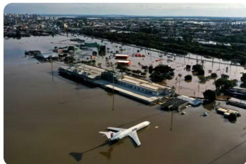
Imagem de drone mostra avião em meio a alagamento no Aeroporto Internacional Salgado Filho, em Porto Alegre, no dia 7 de maio de 2024