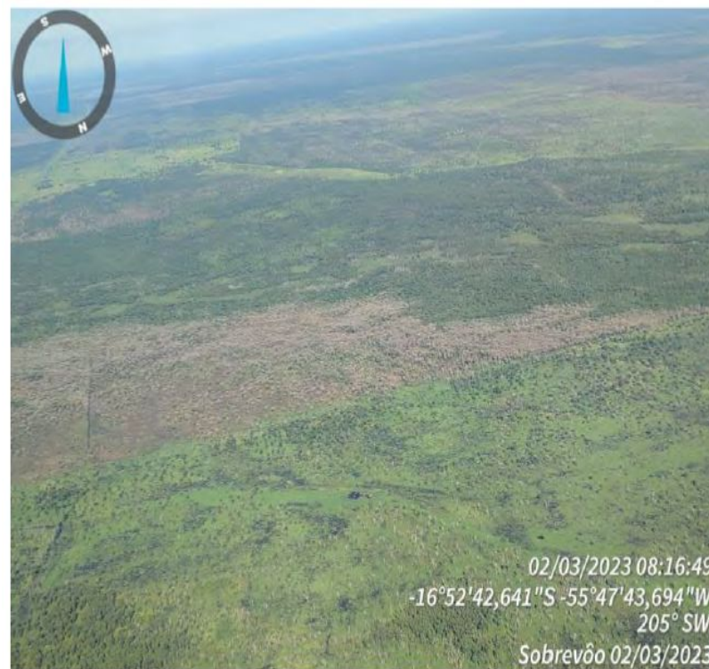
Figura 15 – Vista parcial a área com a vegetação nativa destruída por agrotóxicos com divisa em área não atingida por tais produtos.