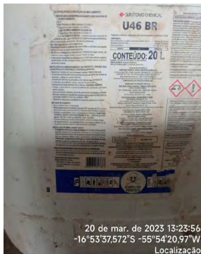
Figura 89 – Galão com conteúdo de 20 litros do U46 BR, agrotóxico.