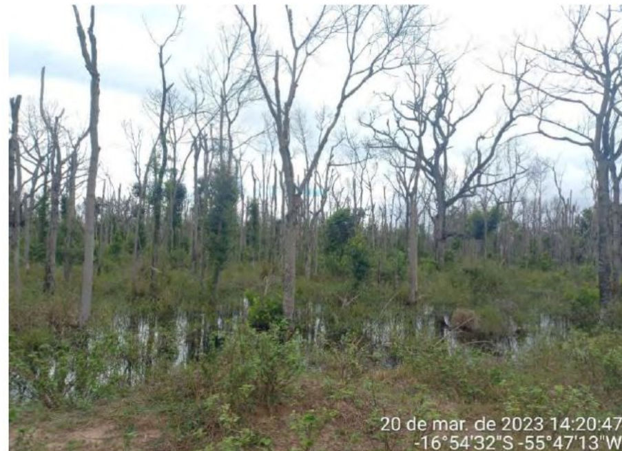
Figura 66 – Floresta Estacional Semidecidual destruída por meio de agrotóxicos, Fazenda Landy-Indaia.