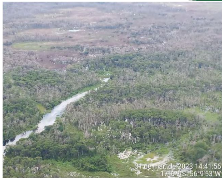
Figura 165 - Destruição da floresta em área de preservação permanente com agrotóxicos.