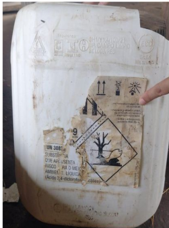
Figura 06 – Vista da embalagem de agrotóxico Classe 9, herbicida sistêmico para folhas largas, de alta toxicidade e de grande risco ao meio ambiente, identificado como Ácido 2,4 – Diclorofenoxi-sódico, usado para armazenar irregularmente óleo diesel.