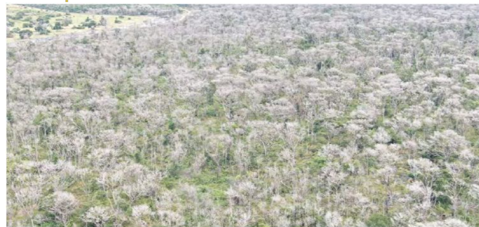
Figura 48 - Vista parcial da área com floresta estacional semidecidual, inundada, destruída por meio de agrotóxicos, Fazenda Landy-Indaia. Coordenadas geográficas 16° 54' 12,58"s e 55° 47' 12,43"w.