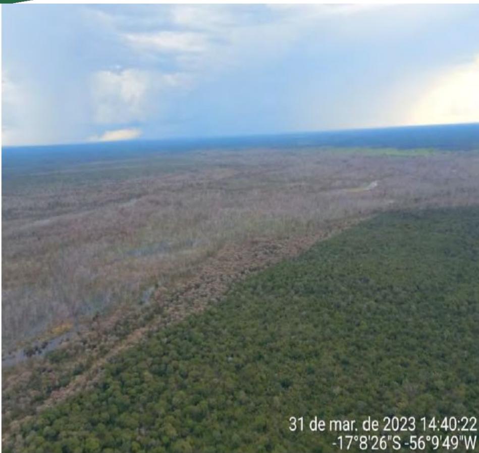
Figura 160 - Destruição da floresta em área de preservação permanente com agrotóxicos.