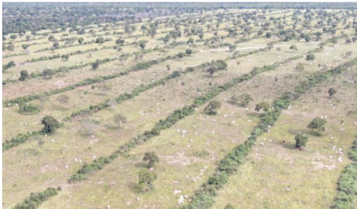
Figura 77 – Atividade de pecuária sem licença ambiental sobre área embargada, descumprimento de embargo, dificultando e impedindo a regeneração natural, localizados na Fazenda Comando Diesel atualizado para Landy-Indaia sob o CAR MT180255/2020.