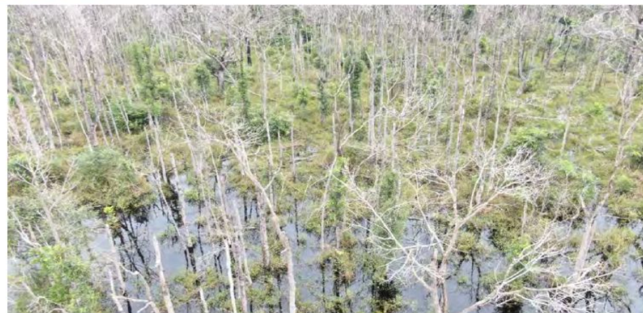
Figura 59- Vista parcial da árvores mortas, Fazenda Landy-Indaia. Coordenadas geográficas 16^{\circ} 54' 32,29''\text{s} e 55^{\circ} 47' 13,14''\text{w} .