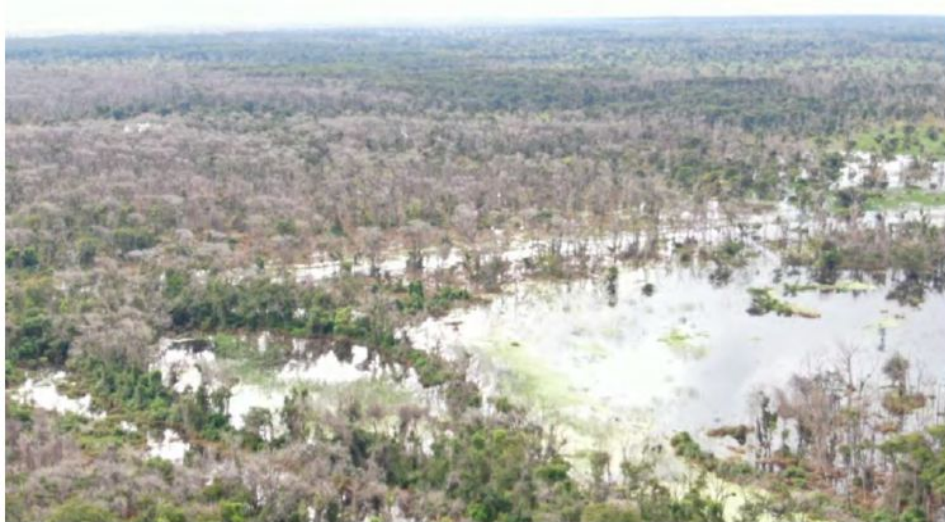
Figura 85 - Vista parcial da floresta remanescente divisa com a floresta destruída.