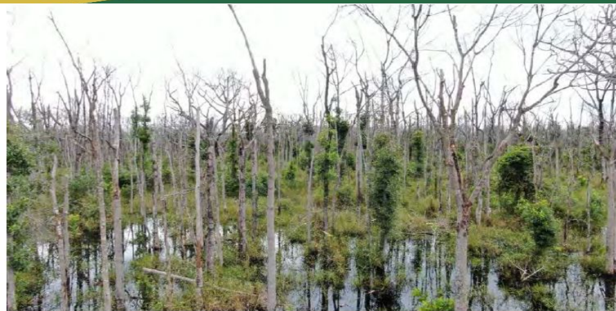
Figura 60 – Vista parcial da árvores mortas, Fazenda Landy-Indaia. Coordenadas geográficas 16^{\circ} 54' 32,29''\text{s} e 55^{\circ} 47' 13,14''\text{w} .