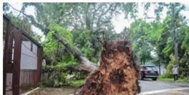
Aniversário do temporal de janeiro

O contato da vegetação com as redes elétricas é responsável por cerca de 80% das interrupções no fornecimento de energia elétrica.