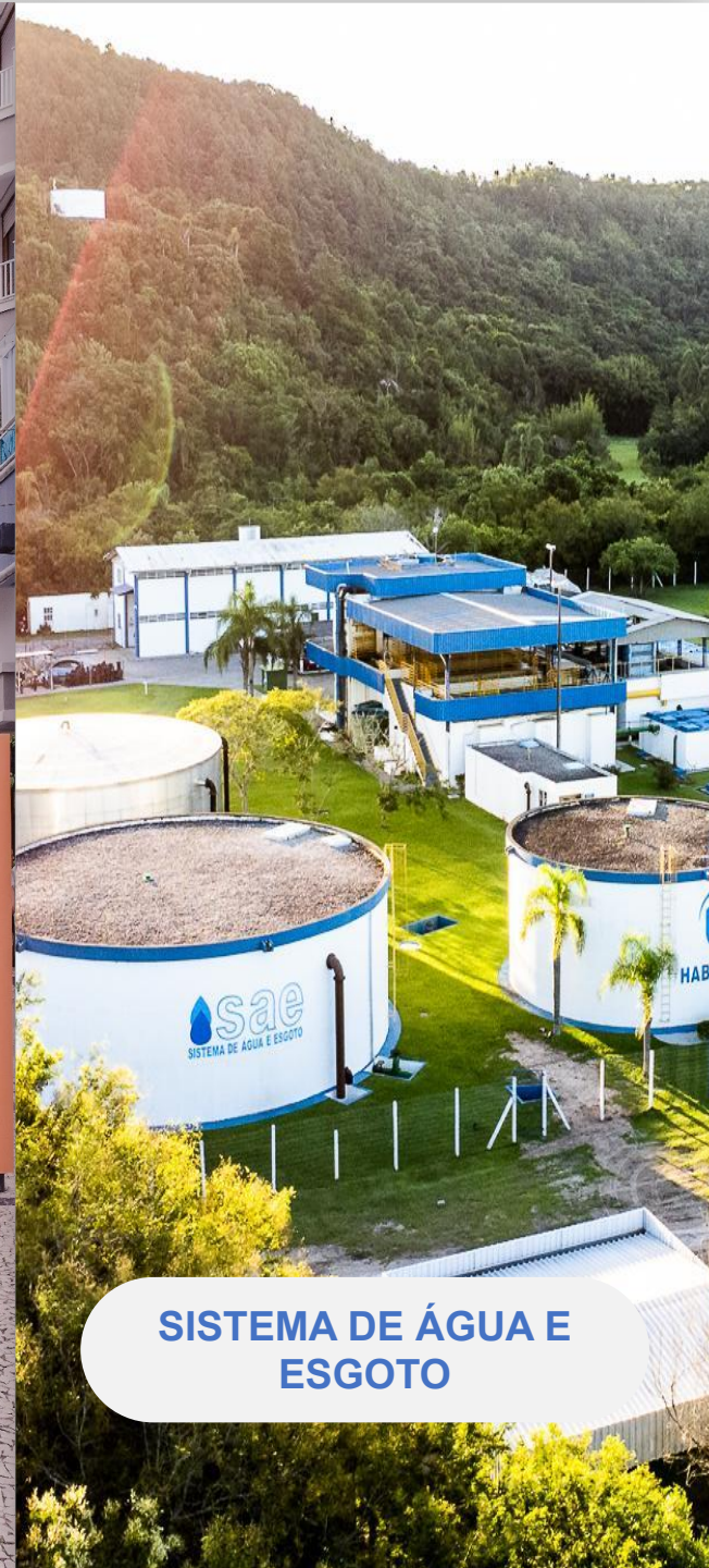
SISTEMA DE ÁGUA E ESGOTO