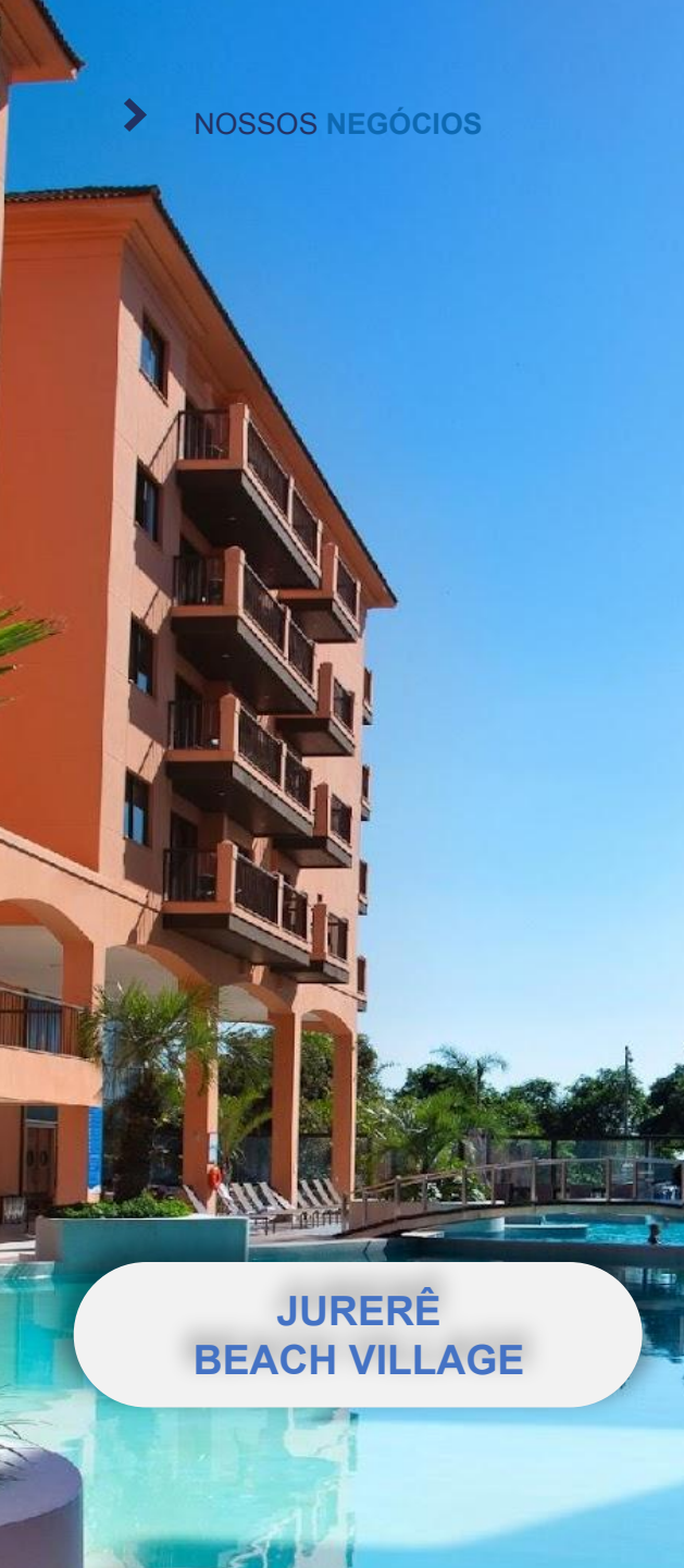
JURERÊ BEACH VILLAGE