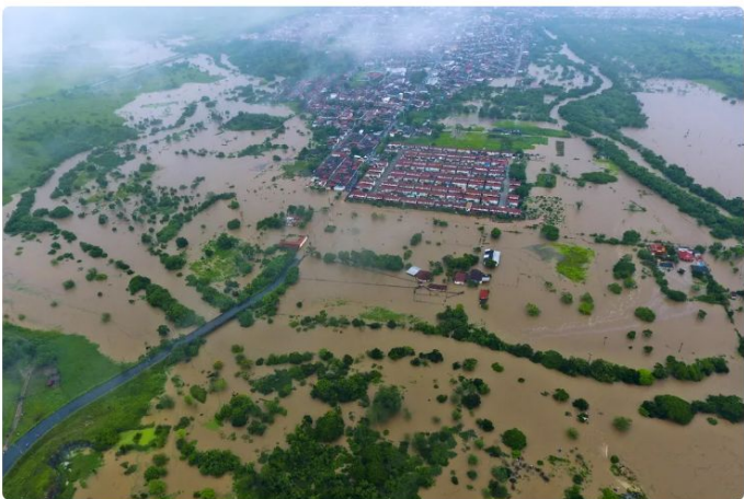
Foto aérea das enchentes causadas por fortes chuvas em Ilhéus, no sul da Bahia, no domingo (26)

https://g1.globo.com/bahia/noticia/2021/12/30/com-maior-volume-de-chuva-nas-ultimas-decadas-no-mes-de-dezembro-bahia-tem-desafio-para-reconstrucao-de-cidades-otm/